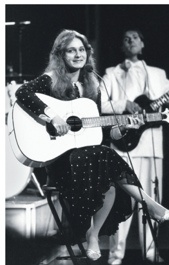
Es war einmal: die Sängerin Nicole, die 1982 beim ESC gewann.

Die Geschichte des ESC selbst lässt sich schnell erzählen: Anfangs ging es festlich zu, in Abendrobe und Smoking, dann wurden die Röcke kürzer, schließlich übernahmen erst die Hippies, dann zog Disco bei dem Schlagerfest ein. Deutschland trat sich in all den Jahren schwer, auch weil